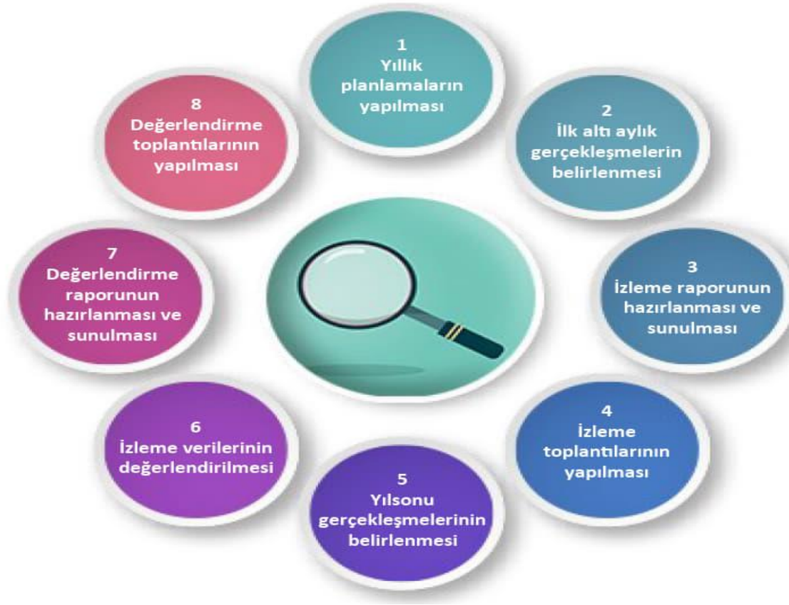
Şekil-4 İzleme ve Değerlendirme Süreci

İzleme ve değerlendirme sürecinin işleyişi ana hatları ile yukarıdaki şekilde özetlenmiştir.